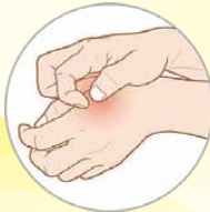
— Κνησμός (Φαγούρα)