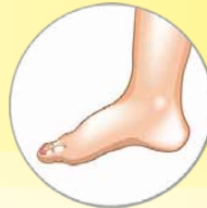
— Οίδημα - Πόνος