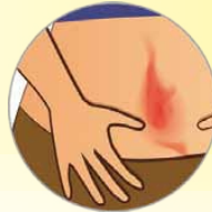
— Εξάνθημα (Κοκκινίλα)