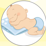
— Παράτριμμα (Σύγκαμα)