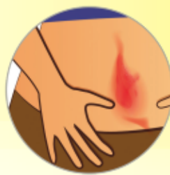
— Εξάνθημα (Κοκκινίλα)