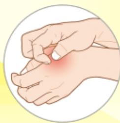
— Κνησμός (Φαγούρα)