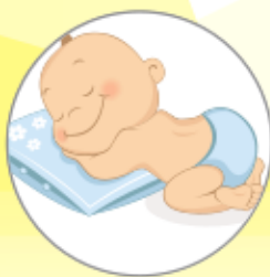
— Παράτριμμα (Σύγκαμα)