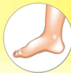
— Οίδημα - Πόνος